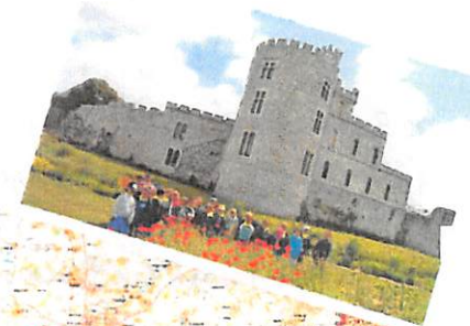
Sorties selon les projets de l'année