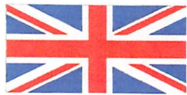
Apprentissage de l'anglais dès la maternelle