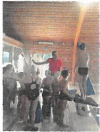
Piscine à Bapaume