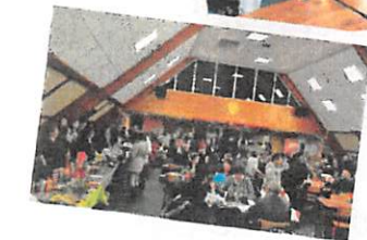
Le marché de Noël