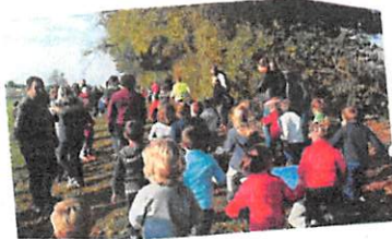
Le CROSS du RPI de la toute petite section au cm2