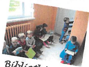
Bibliothèque dans Chaque classe