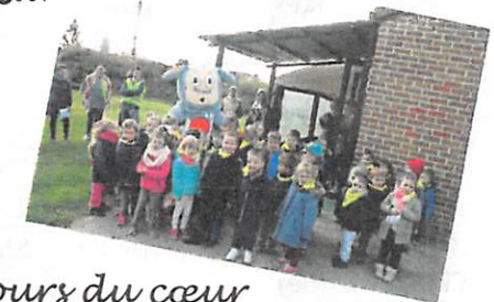
Parcours du cœur