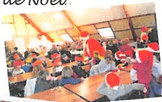
Le repas de Noël.